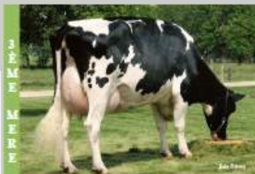
Crocket-Accres Mtot ELLY EX 90 2ème : 305 j 12 447 kg 45 TB et 33 TP

EXPLODE atteint des sommets : Il progresse encore en lait (+200 kg), en Type (+0,2), ainsi que dans les fonctionnels et il reprend au final plus de 200 points au GTPI. Sa grand-mère est la pleine soeur de OTTO et EIGHT. Son demi-frère : ESTEEM (Planet) est également disponible.