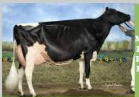
Rainyridge Talent Barbara EX 95 2ème : 305 j 13 762 36 TB et 32 TP