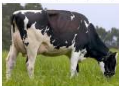
Alino Xirra Rojo Espagne