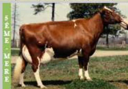
Kentville tins Léa-red 3ème : 305 j 11 286 45TB et 34 TP

Mr TOP RC , Fils de Goldwyn confirme sa place de N°1 des Facteurs rouge au Canada en Conformation (+17) et en Mamelle (+18). Il excelle aussi sur le poste membres avec des notes impressionnantes et une place de N°2 des RC pour les Membres. Mr TOP RC dispose aussi d'index fonctionnels remarquables ( 112 en longévité, 2,57 en cellules).