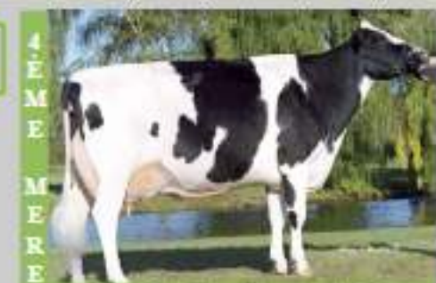
Rainyridge Tony Beauty EX 96 7ème : 305 j 11 819 34 TB et 32 TP

BARBWIRE RED , N°1 en Type (+3,4) des taureaux rouges. Un profil exceptionnel issu de 4 Générations EX, remontant à la célèbre Rainyridge Tony Beauty EX 96. BARBWIRE RED apportera de la puissance et de la profondeur de corps, ainsi que des pis hauts et larges. Son origine nouvelle permettra une utilisation plus large et plus facile.