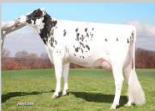
Wabas h-Way EMILYANN VG 88 1ère : 305j 14 928kg 39TB et 34 TP