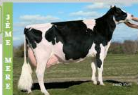
Windsor-manor Rudolph Zip EX 95 5ème : 305j 13 376 kg 27 TB et 29 TP

ZORRO-P Red , est un fils de Lawn boy, rouge et sans cornes issu d'une September qui remonte via une Garter EX 91 à la célèbre Windsor-manor Rudolph Zip EX 95. ZORRO-P Red transmet des attaches de pis très hautes, les membres sont positionnés idéalement avec des talons épais, il est aussi le meilleur Rouge polled actuellement disponible en Type avec une note de 2,4.