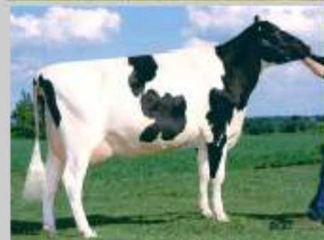
Brummer Talitha VG 87 1ère : 305 j 13 720 kg 35 TB et 33 TP