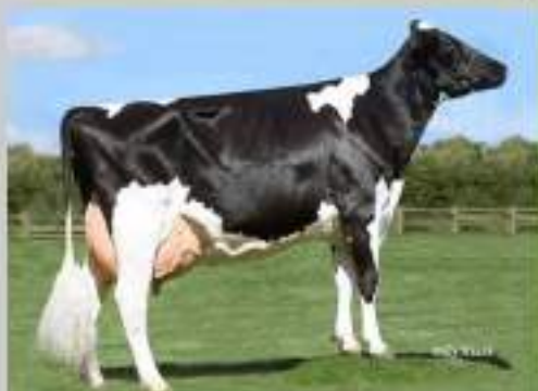
Windsor-manor Ze Special EX 91 2ème : 305j 14 882 kg 45TB et 30 TP